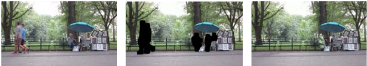
Abb. 1: Anonymisierung in drei Teilschritten

Im gesamten Prozess werden zu keinem Zeitpunkt Bilder oder Videos gespeichert. Der erste Schritt der Bildverarbeitung ist die Anonymisierung der Probandinnen und Probanden. Das Beispiel in Abbildung 1 zeigt dasselbe Kamerabild in drei Verarbeitungsschritten. Erst nach diesen beginnt die optische Analysekomponente mit der Objektdetektion.