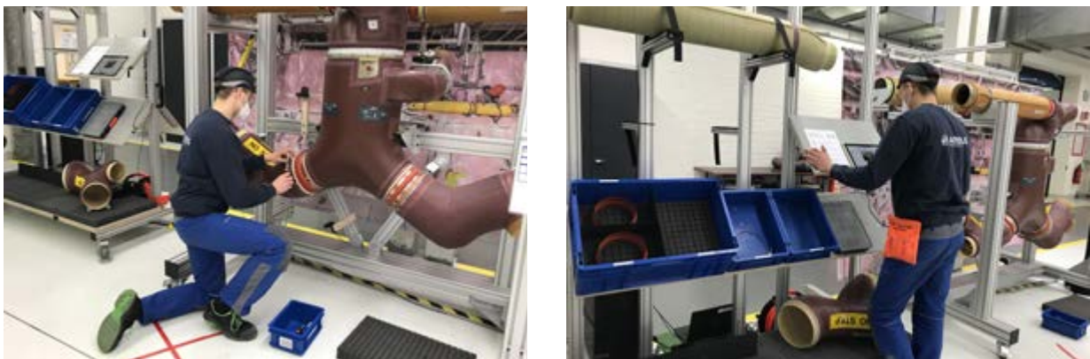
Abb. 2: Training in der Pilotphase am Demonstrator bei Airbus.

Im Anschluss an die Optimierungsarbeiten erfolgt eine zweite Trainingsphase, an welcher auch Fertigungsmitarbeitende teilnehmen werden.