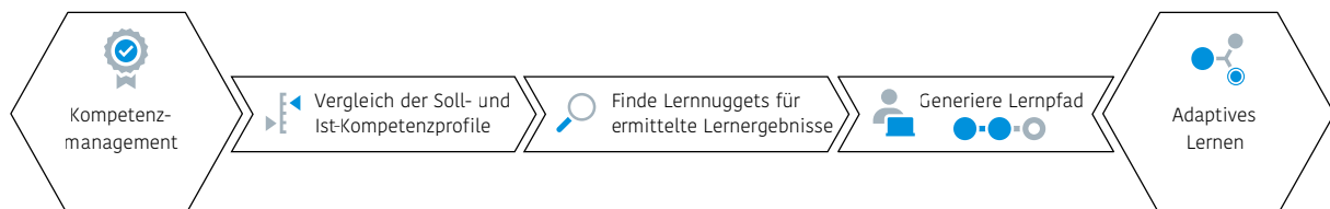
Abb. 1: Von Kompetenzmanagement zum adaptiven Lernen.

Anhand des Vergleichs des Soll- und des Ist-Kompetenzprofils wird das Lernpotential bestimmt. Für den Lernenden werden dazu die relevanten Lernergebnisse ermittelt und die entsprechenden Lernnuggets zu einem Lernpfad zusammengeführt. Daraus resultiert ein individuell angepasstes Lernerlebnis.